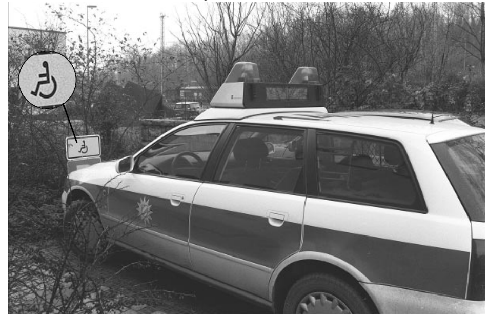
Die Polizei, mein Freund und Helfer! Nur mit manchen Verkehrszeichen haben die grünen Männkens noch ihre liebe Not. Da muß ich wohl jemand anderen um Rat bitten...

Was ich will? Ich sag' Euch, was ich will: Blut, Tränen, Schweiß und Freiheit.